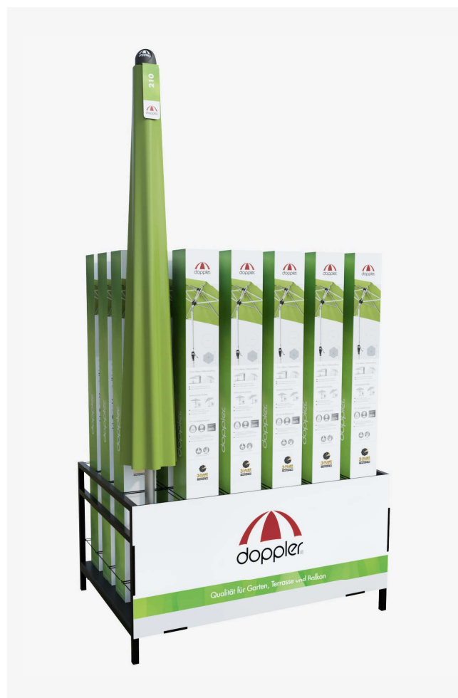
GRID RACK POUR 23 CARTONS