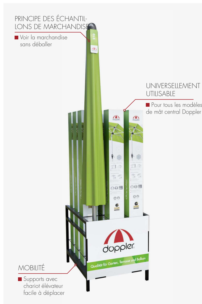
GRID RACK POUR 11 CARTONS

Une présentation convient à tous les modèles de mât central Doppler en deux tailles. Les deux supports peuvent être facilement déplacés avec un chariot élévateur. Selon le principe de la marchandise type, le déballage de la marchandise n'est plus nécessaire.