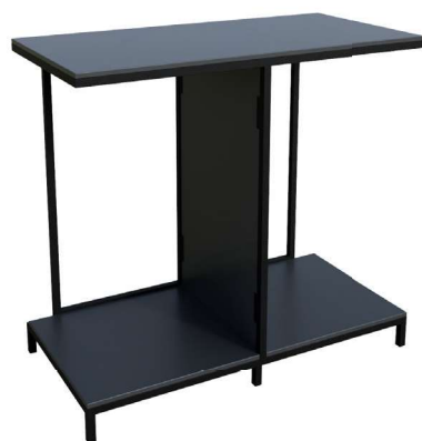
TABLE DE SOCLE

■ présentation d'accessoires facilement mobiles sur roulettes