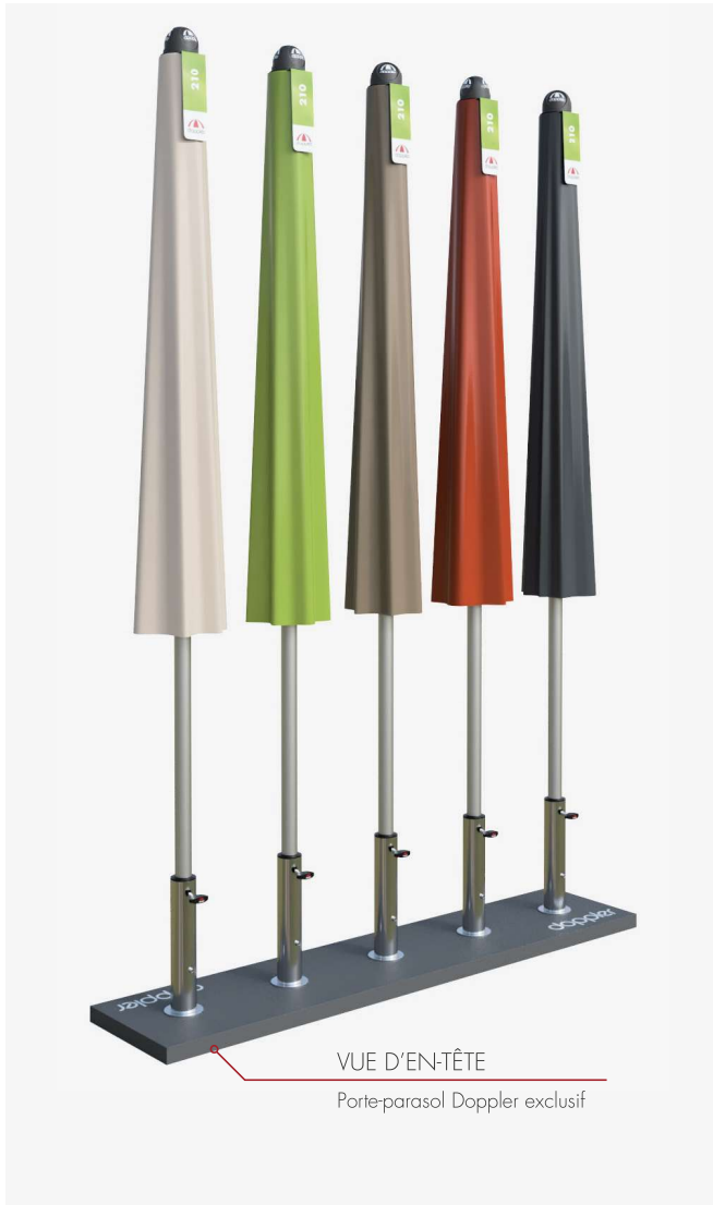
VUE D'ENTÊTE Porte-parasol Doppler exclusif

Pour un parasol ouvert. Le porte-marchandises peut également jouer le rôle de diviseur d'espace dans l'exposition.